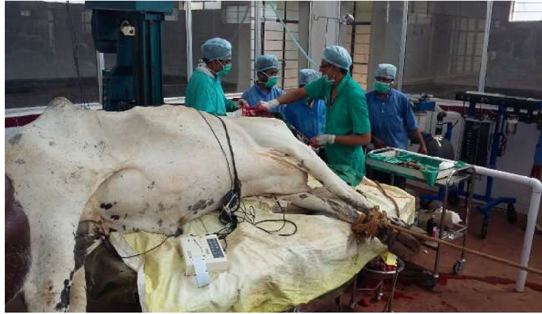
ಸರ್ಜರಿಗಾಗಿ ಸಿದ್ಧಗೊಂಡಿರುವ ಕೃಷಿ ಕೃಷಿ ಪ್ರಾಣಿಗಳಿಗೆ ಸುಸ್ತು