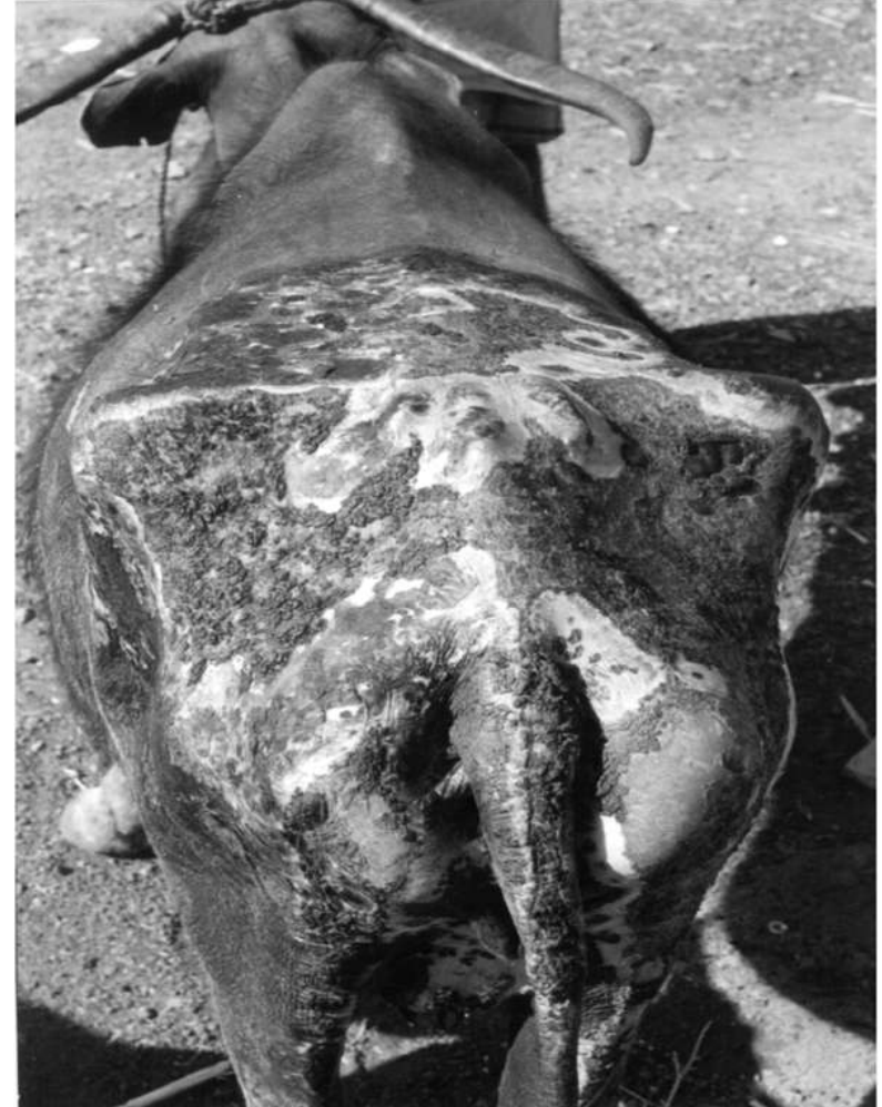
ಒಲಿವೆ ಗಿಡದ ಬಳಕೆ

7. ಒಲಿವೆ ಗಿಡದ ಬಳಕೆ : ಒಲಿವೆ ಗಿಡದ ಬಳಕೆ 10 ನಿಮಿಷ ಎರಚಿದಾಗ ಬಿಸಿಯು ಮತ್ತಷ್ಟು ಒಳಗಡೆ ತಲುಪುವುದು PÄ a ÄiÄUg o ÄzÄ. EzlgÄ EAvlgÄ ಒಲಿವೆ ಗಿಡದ ಬಳಕೆ PÄ a ÄzÄ ÄÄqÄei SmÄiÄ o e ÄÄzÄPÄvÉ ÄÄr UÄ½, zKE¼Ä ÄÄvÄU o KEÄAPÄ vÄU o zÄvÉ PÄ¥Äqg o ÄzÄ.