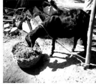
ಗರ್ಭಧರಿಸಿದ ಮೇಕೆಗಳಿಗೆ ಸಮತೋಲನ ಆಹಾರ ಮತ್ತು ಮೇವು ನೀಡಿ