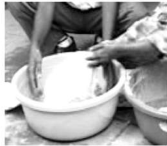
ಸಮತೋಲನ ಆಹಾರ ನೀಡಿ