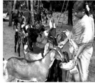
ಕೈ ತೊಂಡಿ ನೀಡಿ