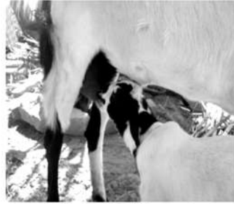
ಮರಿಗಳಿಗೆ 2 ತಿಂಗಳವರೆಗೆ ಹಾಲು ಕುಡಿಸಿ