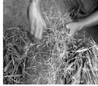
ಮೃದುವಾದ ಹಸಿರು ಮೇವನ್ನು ನೀಡಿ